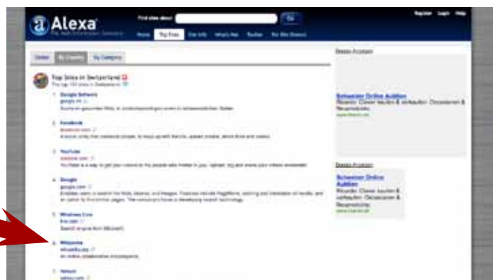
Statistiques données par Alexa pour le mois de novembre 2009.

Projet phare de la fondation Wikimedia, Wikipédia s'est imposée comme un média de premier ordre. En Suisse, la version en langue française ( http://fr.wikipedia.org ) est le sixième site le plus visité ( http://www.alexa.com/topsites/countries/CH , consulté le 28 novembre 2009). Des médias reconnus tels que Le Temps ou la Radio suisse ro-